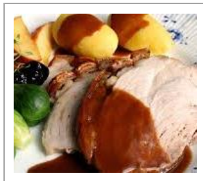
Forslag 1 - Kr 530,- per person

Ta kontakt for en uforpliktet samtale, så tilpasser vi meny og pris etter dine ønsker!