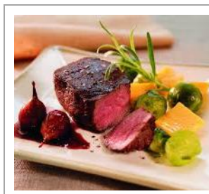
Forslag 2 - Kr 779,- per person