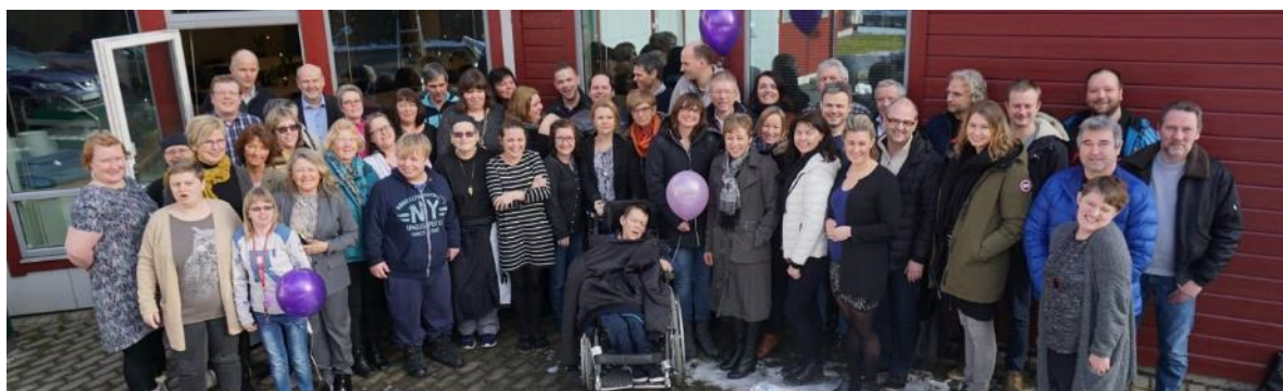
Bilet over tilsette frå fusjonsfesten

Gløde starta i 2017 opp med delproduksjon for Inwido (naboverksemd på avd. Mjåtveit). Arbeidet består i montering av gummi i vindaugslister. Arbeidet er sesongprega. Produksjonen skjer i avdeling Logistikk og Service på Mjåtveit og gjev arbeid både til deltakarar i VTA- og AFT-tiltaket.