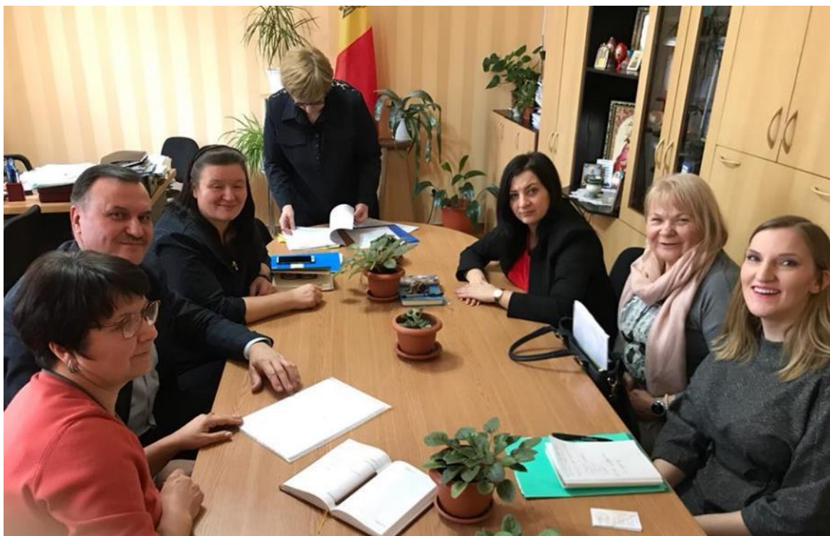
Samarbeidsmøte mellom Gløde og involverte partar i Balti i Moldova

pga. vanskelege økonomiske føresetnader i Moldova og stadige politiske skifter. Haust 2017 tilsatte vi ein prosjektleiar i Gløde som sikrar tettare oppfølging av prosjektet. I byrjinga av desember 2017 vart det underteikna tilleggsavtale (addendum) med dei tre kommunane. I denne forpliktar kommunane seg til å aktivt jobbe for å etablere slike verksemdar i sine kommunar. Vårt mål er at verksemdane skal verta etablert og starta opp i løpet av 2018. Vidare skal dei dagleg leiarane kome til Gløde for å få opplæring. Prosjektet vil løna dei tre daglege leiarane det første året. I januar 2018 godkjente UD utvida tid til ut 2019.