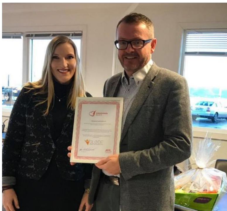
Samarbeidsavtale om Inkluderande bedrift med lokal verksemd